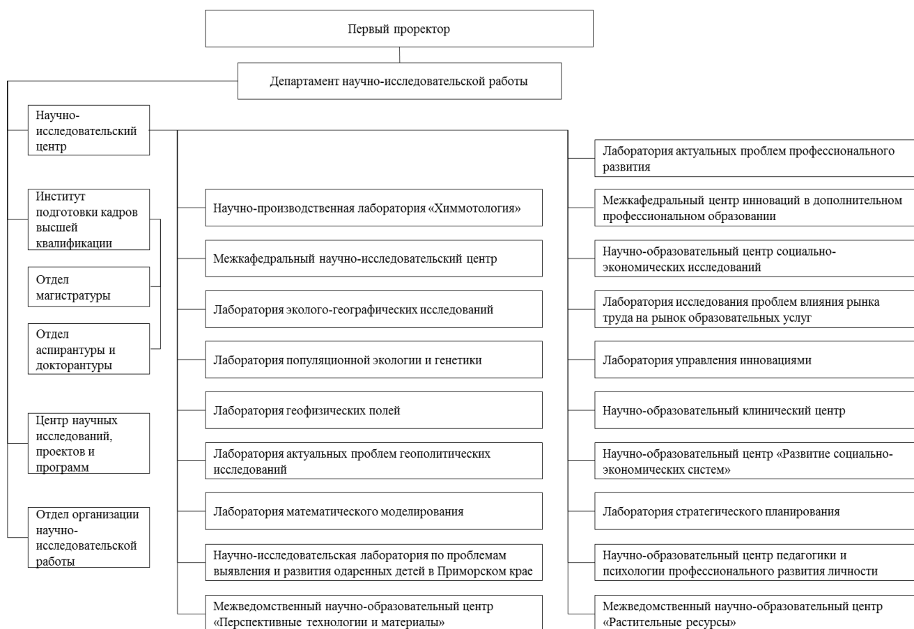
Рисунок 3.1 Организационная структура научно-исследовательского комплекса ВГУЭС

Организационная структура научно-исследовательского комплекса ВГУЭС приведена на рисунке 3.1.